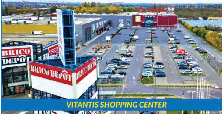
VITANTIS SHOPPING CENTER

Alışveriş merkezlerimizde kiracılarımıza en iyi fiyatları ve imkanları sunuyoruz