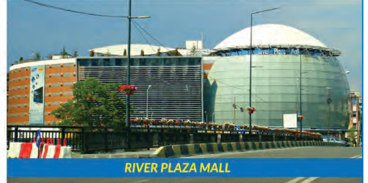
RIVER PLAZA MALL

BISTRITA RETAIL PARK • FORTUNA SHOPPING CENTER • CENTRUL COMERCIAL BÂRLAD • CENTRUL COMERCIAL FOCSANI • CENTRUL COMERCIAL TULCEA