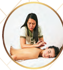
THERAPIES WITH FILIPINO SPECIALISTS

MASTER DETOX • GREEN JUICE DETOX • RAW FOOD DETOX