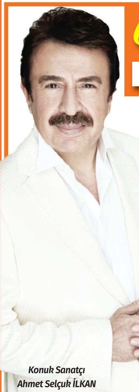
Konuk Sanatçı Ahmet Selçuk İLKAN

Unutamayacağınız bir gece yaşayacaksınız