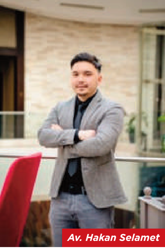
Av. Hakan Selamet

erişilebilirlik arasında bir denge ile karakterize edildiğini düşünüyorum. Her dosyanın arkasında kişisel bir hikâye vardır ve benim rolüm, bu hikâyeyi doğru, eksiksiz ve etkili bir hukuki sürece dönüştürmektir.