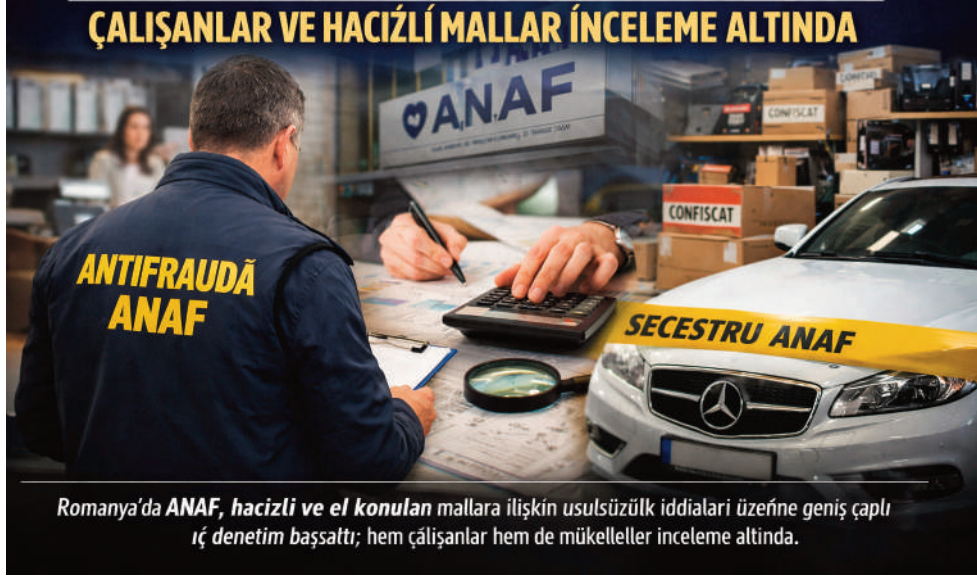
Romanya'da ANAF, hacizli ve el konulan mallara ilişkin usulsüzlük iddiaları üzerine geniş çaplı iç denetim başlattı; hem çalışanlar hem de mükellefler inceleme altında.

Nica, sorumluların iki grupta değerlendirildiğini ifade ederek, "Hacizli malları