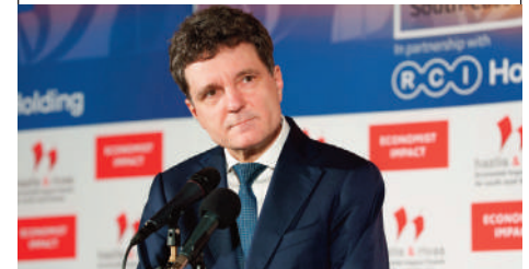
Cumhurbaşkanı Dan, İngiliz Ekonomist dergisinin Bükreş'te gerçekleştirdiği etkinliğin açılış konuşmasında akaryakıt fiyatlarını gündeme taşıdı. Sayfa 7'de