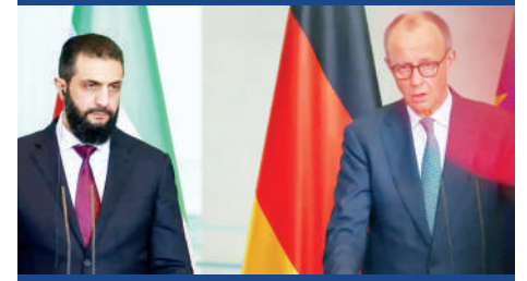
Almanya Başbakanı Friedrich Merz Suriyelilerin üç yıl içerisinde ülkelerine döneceğini açıkladı. Sayfa 7'de