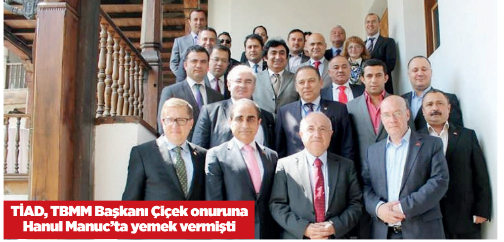
TİAD, TBMM Başkanı Çiçek onuruna Hanul Manuc'ta yemek vermişti