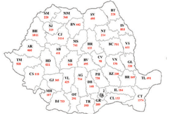
Situația locurilor de muncă vacante

1 BUCUREȘTI: 7873 2 ILOVO: 2721 Sursa: ANOFM - 04.03.2026